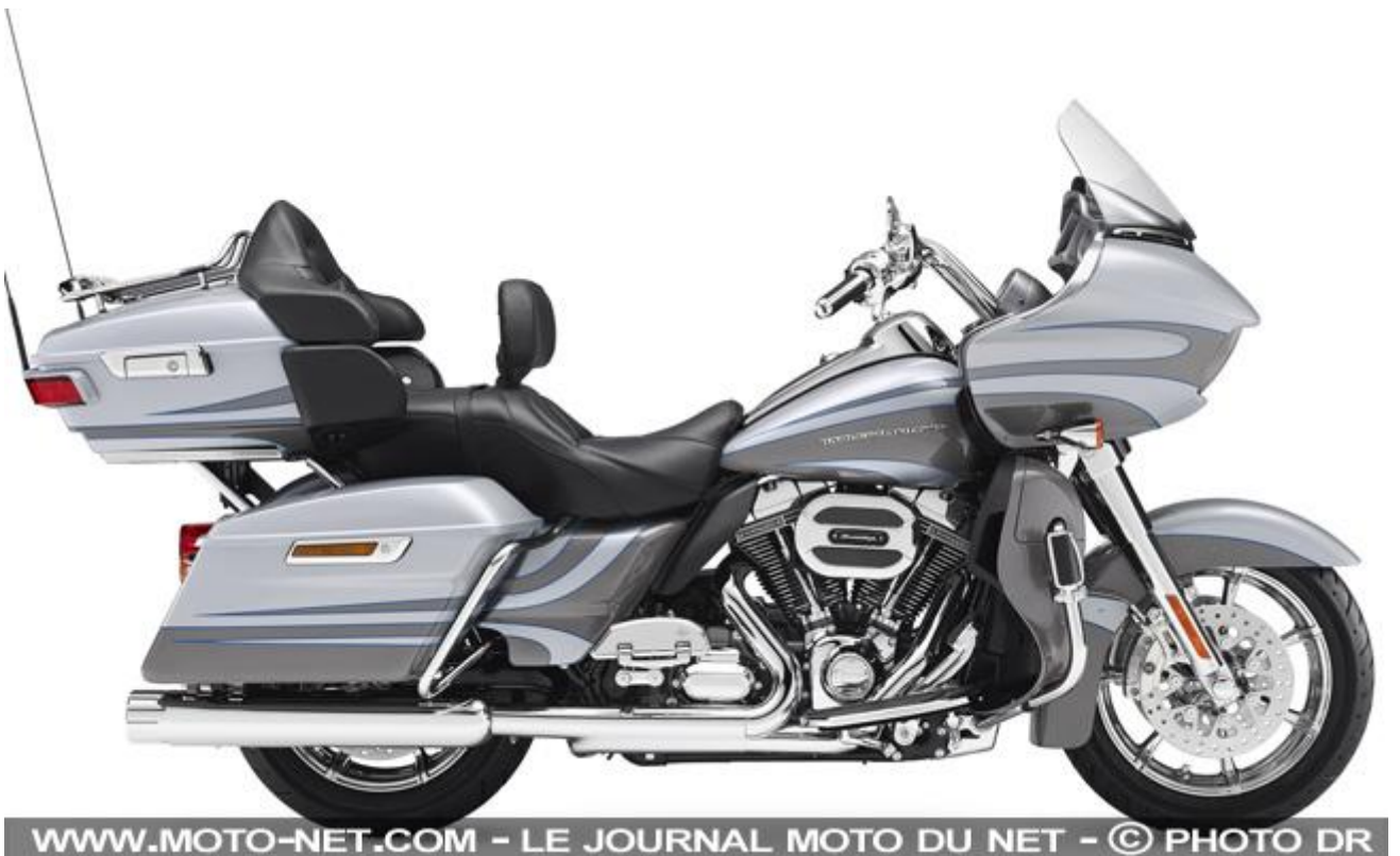
Harley-Davidson CVO Street Glide 2016

WWW.MOTO-NET.COM - LE JOURNAL MOTO DU NET - © PHOTO DR